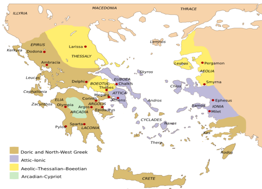
Slika 1: Zemljevid antične Grčije

Za lažjo predstavo Grčije v antiki prilagamo sliko spodaj. Iz slike 1 je razvidno ozemlje Šparte in Aten ter drugih polisov v takratni Grčiji.