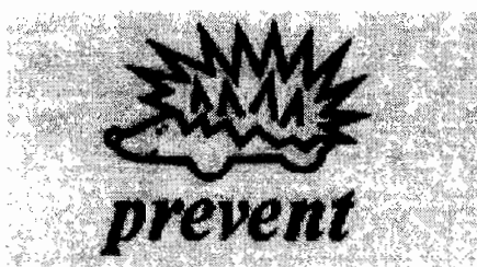
Slika 6.1 Logotip skupine Prevent

V družbi Prevent avtomobilski deli je zaposlenih 1.350 ljudi, največ jih dela v matični tovarni v Slovenj Gradcu (700). Že od začetka leta 2009 pa doma na delo čaka 120 delavk, ki delajo na liniji izdelkov za Volkswagen. Skupno je v Preventu v Sloveniji sicer zaposlenih 1.865 ljudi.