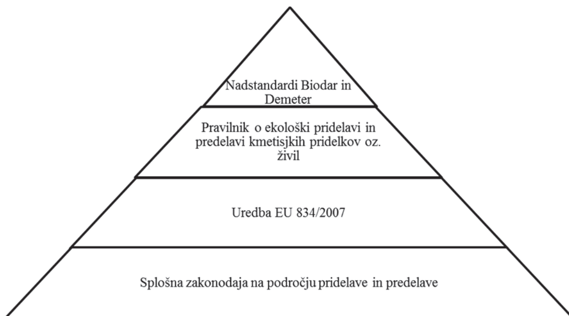
Slika 10: Hierarhični prikaz zakonodaje in standardov ekološkega kmetijstva v Sloveniji

Med cilje kmetijske politike štejemo stabilno pridelavo kakovostne hrane, varstvo kmetijskih zemljišč pred onesnaženjem, trajno povečanje konkurenčne sposobnosti kmetijstva ter načelo varstva okolja in ohranjanja narave (ZKme, 2. člen). Vsi ti cilji se lahko dosežejo s podporo ekološkemu kmetijstvu, ki ima iste usmeritve. Kmetijski pridelek oziroma živilo je lahko označen kot ekološki, če je za ta pridelek oziroma živilo izdan certifikat, ki zagotavlja pridelavo po predpisanih pogojih (ZKme, 40. člen).