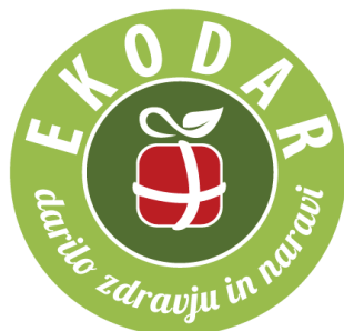
Slika 6: Logotip blagovne znamke Ekodar

Ekodar je leta 2011 registrirana blagovna znamka Kmetijske zadruga Šaleška dolina. Prepoznavnost blagovne znamke Ekodar je pridelava ekološko rejenega goveda. Implementirali so sistem sledenja, ki s kodo QR omogoča uporabnikom pametnih telefonov, da jih poveže na spletno stran ekološke kmetije, s katere meso izvira. Cilj blagovne znamke je širitev na celoten slovenski trg in razširitev ponudbe z ekološko svinjino ( Ekodar 2016a).