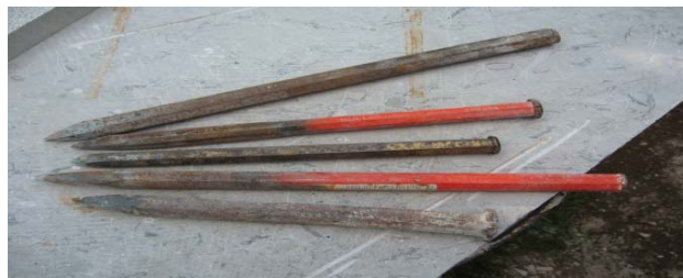
Slika 1: Špica

Kvadre prave in osnovne obdelave – surovce se v delavnicah obdeluje površinsko in profilirano. Pri tem se uporablja ročno orodje. Pred približno stoletjem so začeli uporabljati pnevmatsko orodje in novejšje stroje, v današnjem času pa si lahko pomagajo z računalniško in lesarsko obdelavo. Kamnoseki si z uporabo modernih orodij pomagajo pri oblikovanju kamna. Vseeno pa ostaja načelo, da močna roka kamnoseka in izurjeno oko ne more nadomestiti še tako dober stroj, zato je ročno kamnoseško orodje še vedno prisotno v večini kamnoseških delavnic (Pertot 1997).