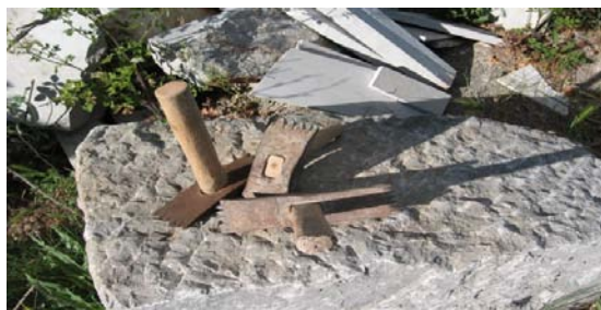
Slika 2: Enostavno kladivo

Za ročno obdelavo kamna je potrebna določena energija in ta izvor energije je človek. Že sama beseda enovrstno kladivo nam pove, da ima to kladivo samo eno vrsto zob, ti zobje pa so precej grobi in redki. V vrsti je od pet do šest zob, ki so nameščeni pravokotno na ročaj, na katerega je kladivo nasajeno.