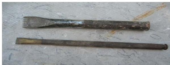
Slika 3: Dleta

Za ročno obdelavo kamna je potrebna določena energija in ta izvor energije je človek. Že sama beseda enovrstno kladivo nam pove, da ima to kladivo samo eno vrsto zob, ti zobje pa so precej grobi in redki. V vrsti je od pet do šest zob, ki so nameščeni pravokotno na ročaj, na katerega je kladivo nasajeno.