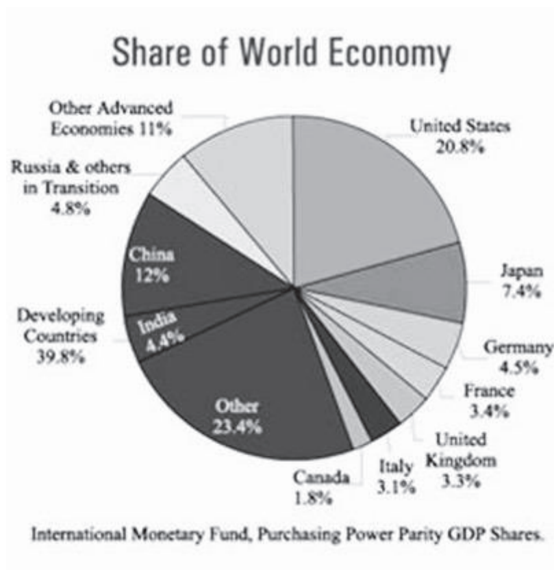
Slika 1: Prikaz deleža svetovnega gospodarstva

Svetovno gospodarstvo je ekonomija sveta in vključuje mednarodno izmenjavo blaga in storitev. Obsega različna gospodarstva posameznih držav, katerih ekonomije so med seboj povezane na tak ali drugačen način. Globalizacija je tako ključni pojem v svetovnem gospodarstvu, je proces, ki vodi do posameznih gospodarstev po svetu in jih tesno prepleta med seboj, kar povzroči, da dogodek v eni državi vpliva na stanje drugih svetovnih gospodarstev. V zadnjem stoletju je bil v vseh pogledih velik poudarek na globalizaciji. Vedno več je bilo trgovanja med različnimi državami, zmanjšale pa so se tudi omejitve gibanja in poslovanja med državami. Zaradi vseh teh sprememb lahko ljudje prodajajo svoje blago po celem svetu, potrošnikom pa je ponujena veliko širša paleta izdelkov in storitev iz širnega sveta in ne samo iz lokalnega okolja.