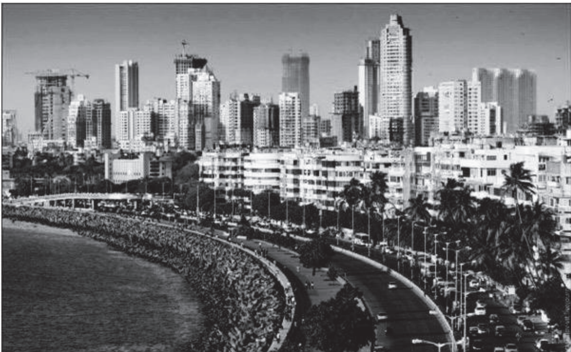
Slika 7: Prestižni del Mumbaja

Zgornja slika prikazuje bedo Indije. Ta slika prikazuje barakarsko naselje Daravi v Mumbaju, kjer živi približno en milijon ljudi na 2,5 km 2 . Ljudje živijo s približno enim ameriškim dolarjem na dan (Marotta 2016).