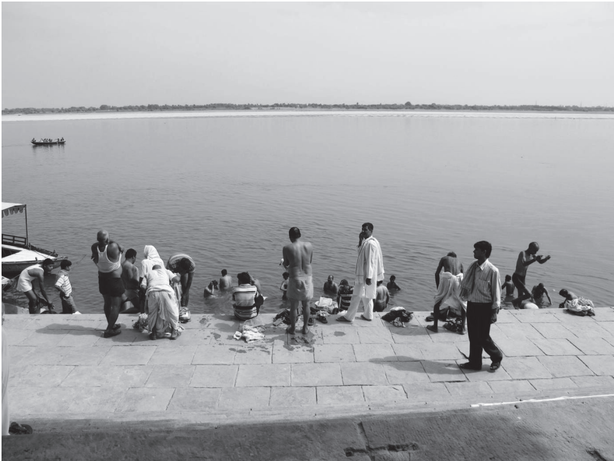
Slika 3: Obred kopanja hindujcev v sveti reki Ganges

Največji in najpomembnejši praznik je Divali. To je petdnevni festival, znan kot festival luči. Naslednji velik praznik pa je praznik Holi, to je festival barv, ki se imenuje tudi festival ljubezni (Zimmermann 2015).