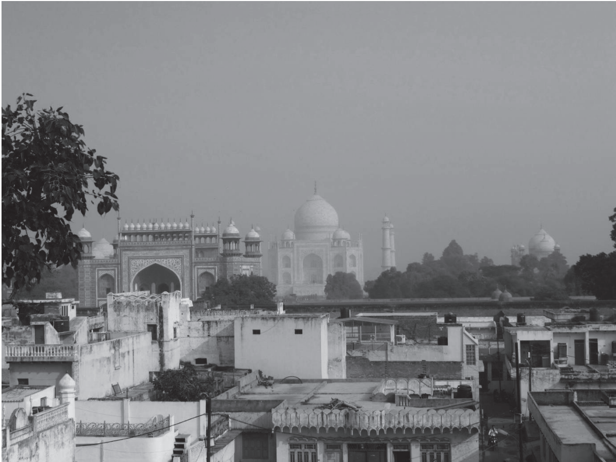
Slika 2: Največji biser indijske arhitekture – Tadž Mahal

izobraževanje, vendar je bil napredek zelo počasen zaradi demokratičnega sistema Indije (Gosai 2013).