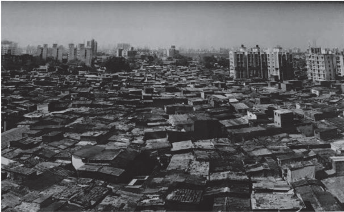
Slika 6: Barakarsko naselje Dharavi (Mumbaj)

Zgornja slika prikazuje bedo Indije. Ta slika prikazuje barakarsko naselje Daravi v Mumbaju, kjer živi približno en milijon ljudi na 2,5 km 2 . Ljudje živijo s približno enim ameriškim dolarjem na dan (Marotta 2016).