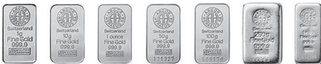
Slika 1: Naložbene ploščice Švicarske kovnice Argor Heraeus

V Sloveniji je že kar nekaj ponudnikov, pri katerih lahko kupimo naložbene palice različnih mas. Od začetka svetovne gospodarske krize je zanimanje po naložbenih palicah močno naraslo tudi v Sloveniji, ljudje so pričeli vlagati svoj denar v zlato predvsem zaradi večje varnosti in tudi želje po zaslužku. Na našem trgu je že kar nekaj ponudnikov naložbenih palic, ki prodajajo in odkupujejo le te, njihova ponudba vsebuje naložbene palice nekaterih svetovno priznanih kovnic, kar nam kasneje tudi olajša morebitno prodajo. Pri nas lahko kupite zlate palice z maso 1, 2, 5, 10, 20, 31,1035 (trojska unča), 50, 100, 250, 500 in 1000 grama. Svetovno priznane kovnice, ki imajo Goos Delivery standard, so Argor Heraeus, Umicore, Valcambi in še mnoge druge. Standard Good Delivery zagotavlja likvidnost zlatih palic v bankah in pri trgovcih po vsem svetu (Kandus in Moro 2010, 32).