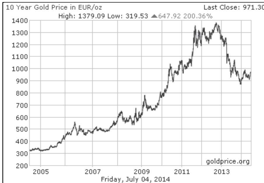
Slika 2: Spremembe cen zlata