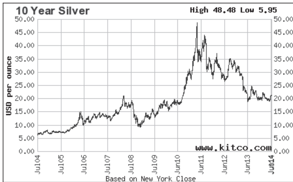
Slika 3: Spremembe cen srebra