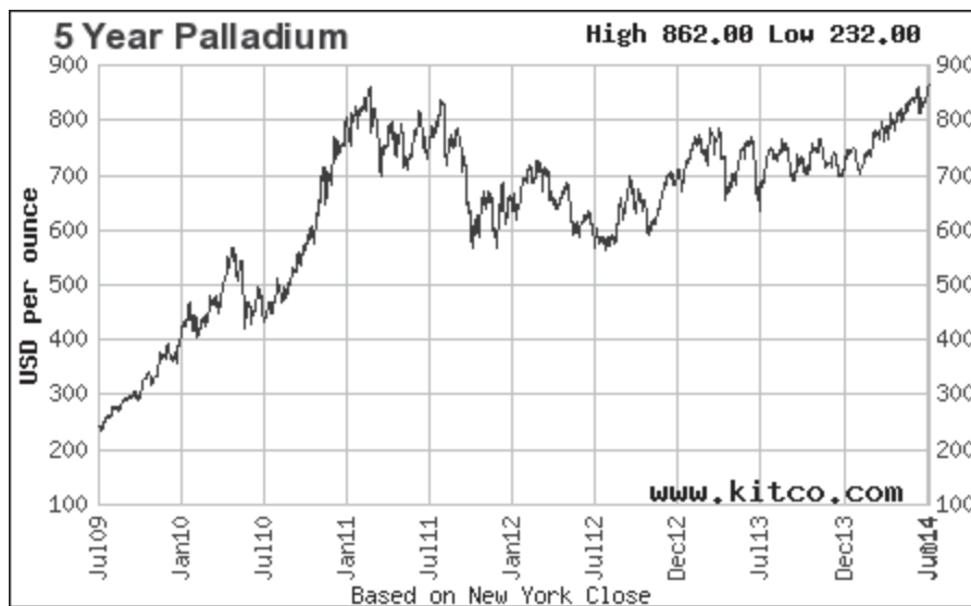
Slika 5: Spremembe cen paladija